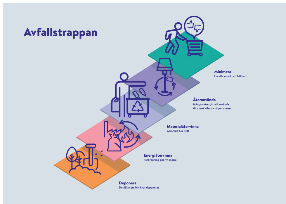
Figur 4 Avfallstrappan, även kallad avfallshierarkin. Vi strävar efter att röra oss uppåt i trappan.

Avfallsplanens mål utgår från EU:s avfallshierarki, eller avfallstrappan som den också kallas. Det betyder att avfall i första hand ska förebyggas och därmed minimeras. I andra hand ska saker återanvändas och i tredje hand materialåtervinnas, dvs bli till nya produkter. I fjärde hand ska avfall energiåtervinnas, alltså förbrännas eller behandlas på annat sätt så att energi tas till vara. I sista hand ska avfall läggas på deponi, det vi ofta kallar soptipp.